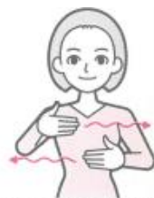
両手を上下に置き、指を振り動かしながら左右方向へ進め、