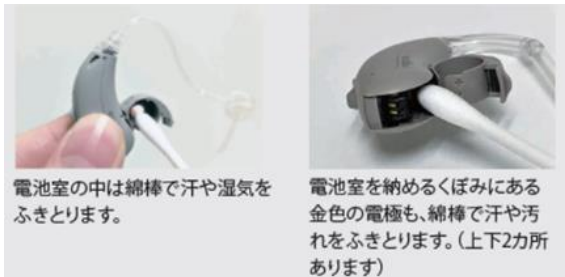
電池室の中は綿棒で汗や湿気をふきとります。