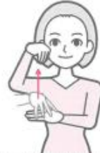
左手甲に右手5指の指先をつけ、上に引き上げながら閉じる