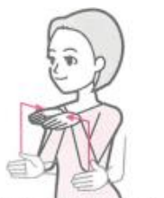
両手で四角い建物の形を描く