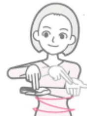
左手掌に右手2指を立て、左右に動かしながら前へ出す